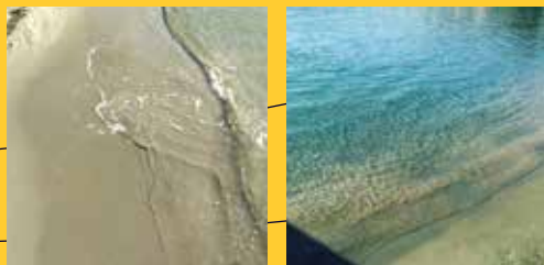
Grecotel, Cape Sounio